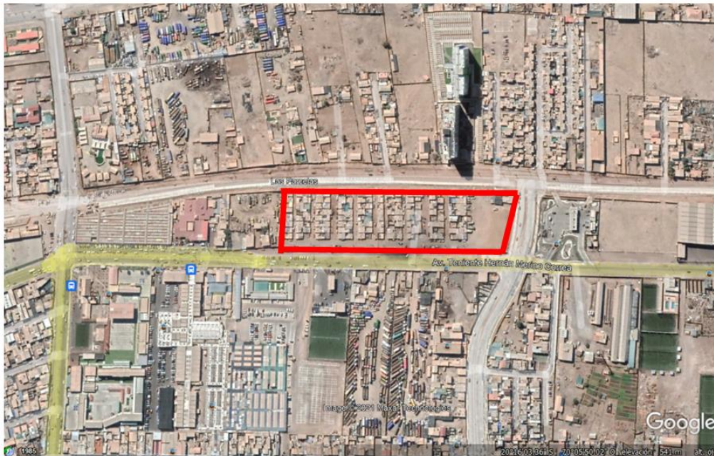
Avenida Teniente Hernán Merino Correa N°3130, comuna de Alto Hospicio.

Proyecto que da solución habitacional a 480 familias y que se compone de 2 torres de 11 pisos y 2 torres de 12 pisos, en un terreno de 21.510,19 m 2 . Para que este se lleve a cabo, se requiere aumentar la densidad permitida por el Plan Regulador Comunal vigente, de 240 a 600 hab/ha. Dicha modificación de la normativa permite una mejora en la localización de viviendas de integración social en la ciudad, ya que utiliza un terreno con atributos urbanos positivos, como por ejemplo estar ubicado al interior del área urbana, próximo al área céntrica, buena conectividad, oferta de transporte público, disponibilidad de equipamiento en el entorno, factibilidad sanitaria, entre otros.